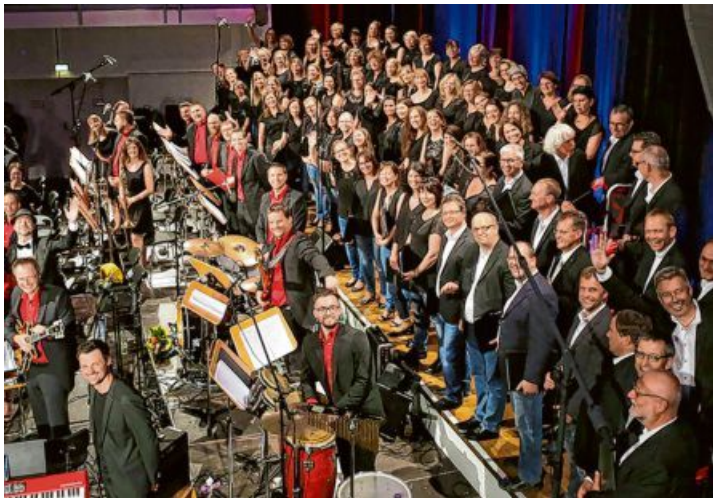
Der Chor Chorissima wird begleitet von den Big Bandits.

Von Karola Kaindl, Gesangverein Gundelsheim e.V.