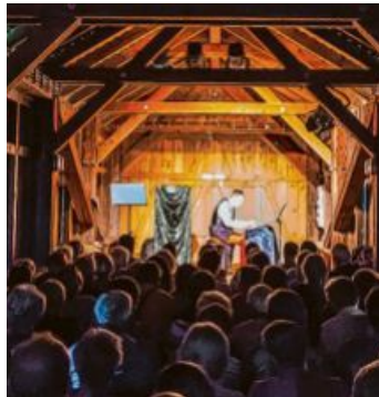
Am 7. Mai 2026 startet das Brückentheater in seine neue Spielzeit.

Den Auftakt macht am 7. Mai die Komödie „Wölfe, Weib und Waldesruh“, in der zwei gegensätzliche Charaktere unfreiwillig aufeinandertreffen und eine konfliktreiche Nacht erleben. Am 14. Mai folgt mit „Die Geliebte meines Mannes“ ein temporeiches Schauspiel rund um Ehe, Intrigen und überraschende Wendungen. Musikalisch wird es am 28. Mai mit „Marilyn Monroe – What a Beautiful Dream“, das Leben und Mythos der Filmikone zwischen Glamour und persönlichem Anspruch beleuchtet.