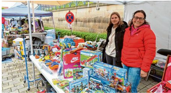
Große und kleine Anbieter werden ihre Waren in der Innenstadt von Bad Staffelstein präsentieren.

Unter dem Motto „STÖBERN – SCHLEMMEN-SHOPPEN“ werden große und kleine Anbieter ihre Waren in der Innenstadt von Bad Staffelstein präsentieren. Neben dem Gebrauchtwaren-Sortiment am Flohmarkt werden auch die innerstädtischen Gastronomen an diesem Tag für kulinarische Highlights sorgen. Zudem werden einige Direktvermarkter ihr regionales Warenangebot präsentieren und gemein-